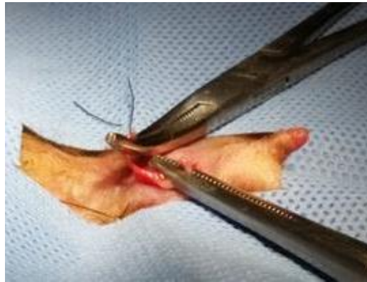
Figura 3. Ducto deferente seccionado aguardando a ligadura das porções cranial e caudal.

Utilizou-se o fio nylon 3-0 para ligadura dos ductos. O procedimento foi realizado no ducto deferente direito e esquerdo. Após o reposicionamento das estruturas em seu local de origem, a síntese da pele foi feita com cola cirúrgica.