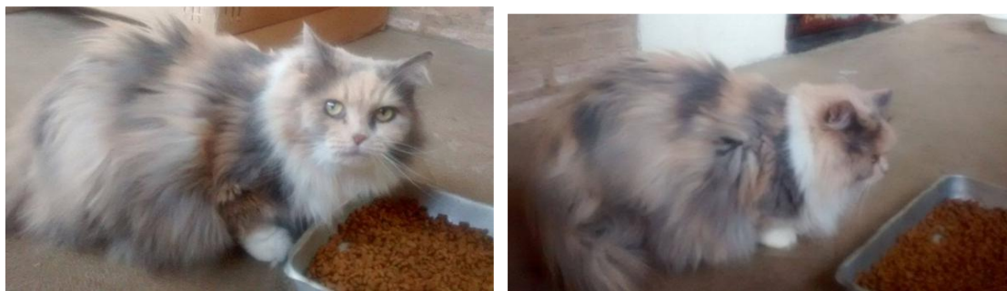
Figura 2. Gato idoso que se alimenta de dieta seca “ad libitum”, o que pode favorecer o desenvolvimento da doença articular degenerativa.

Em estudo de prevalência da doença articular degenerativa em 100 gatos, por Lascelles et al. (3), foi detectada a associação negativa entre a doença e a dieta seca. Segundo os autores, o fato provavelmente deve-se à idade e ao tipo de dieta, ou seja, gatos mais velhos se alimentam com maior proporção desta dieta. Isso reforça a recomendação de alimentar gatos idosos com comida úmida. Na Figura 2 está ilustrado um gato alimentado com uso inadequado da ração.